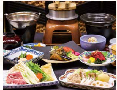
左:信州牛の鉄板焼き/右:ご夕食