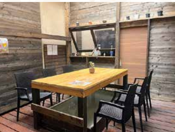
憩いの場として足湯